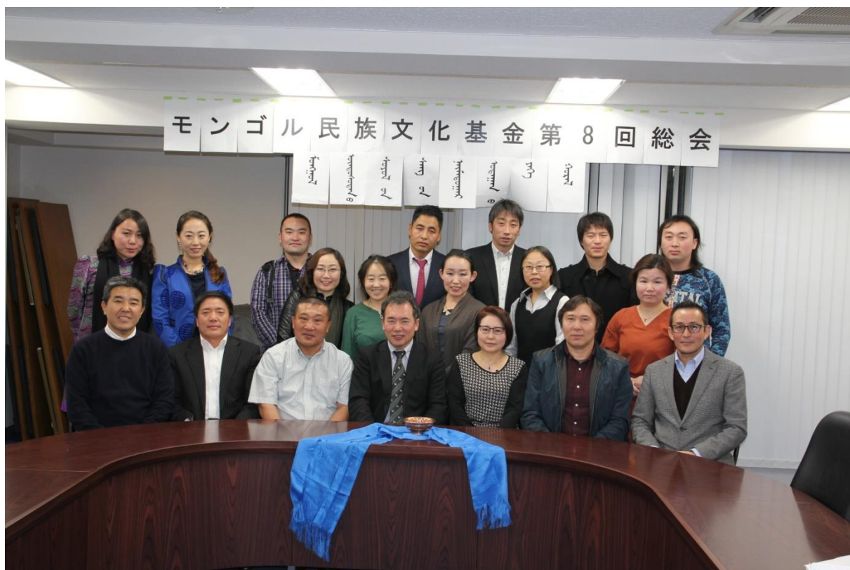
会議参加者集合写真