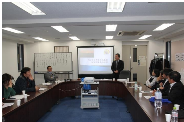
新任理事長のご挨拶