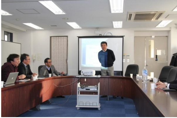
元理事長による基金の紹介