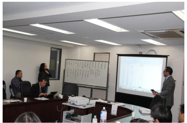
第8回理事会理事選挙