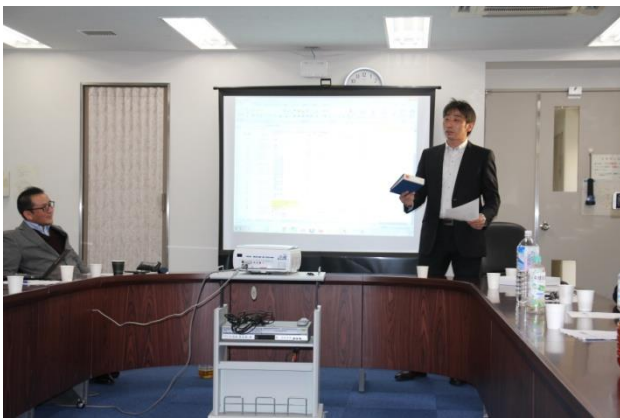
第7回理事会の会計報告