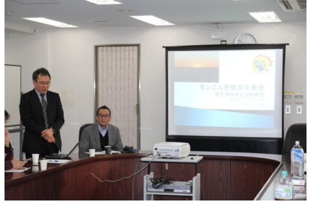
第7回理事会の活動報告